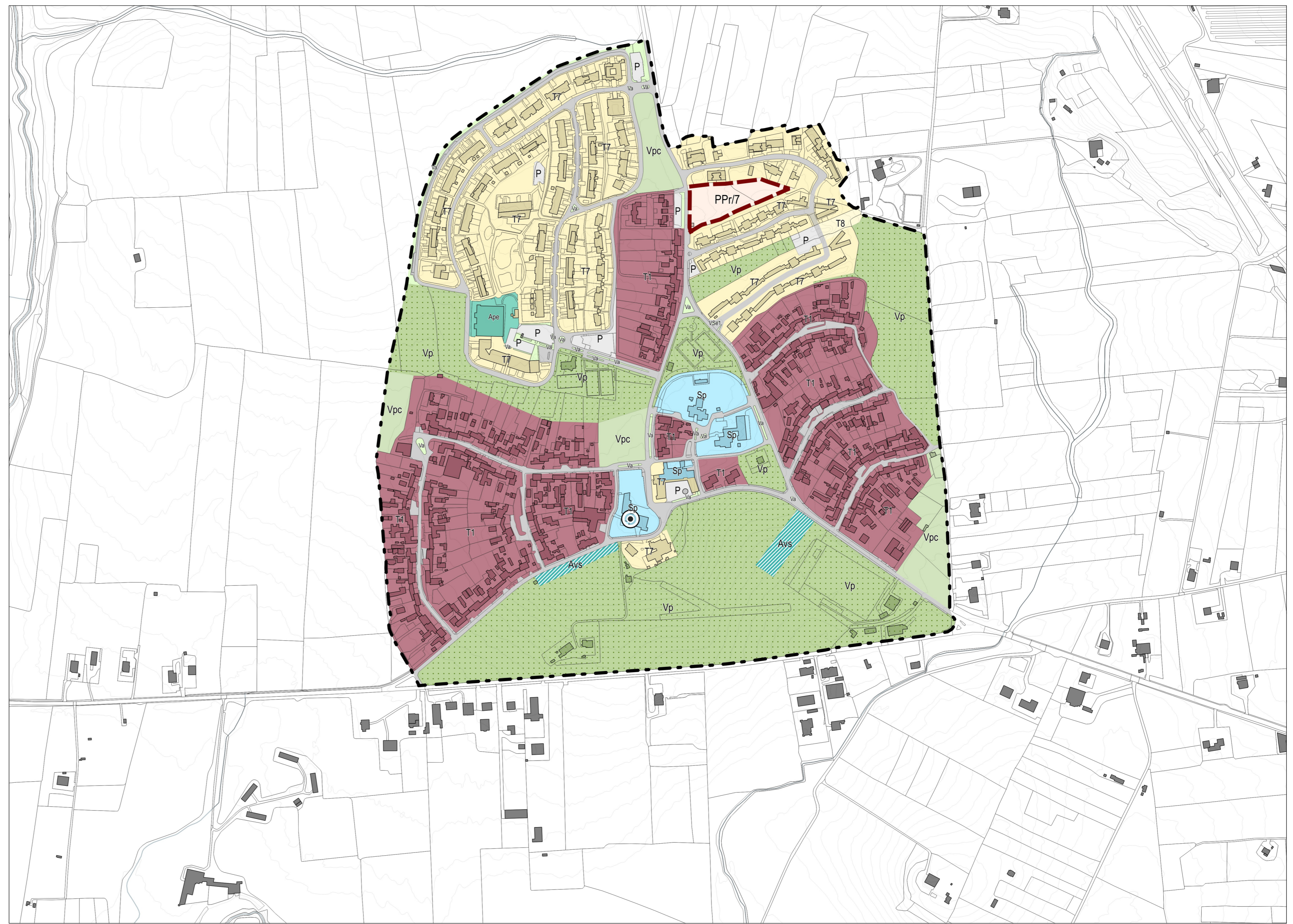
Borgo La Martella