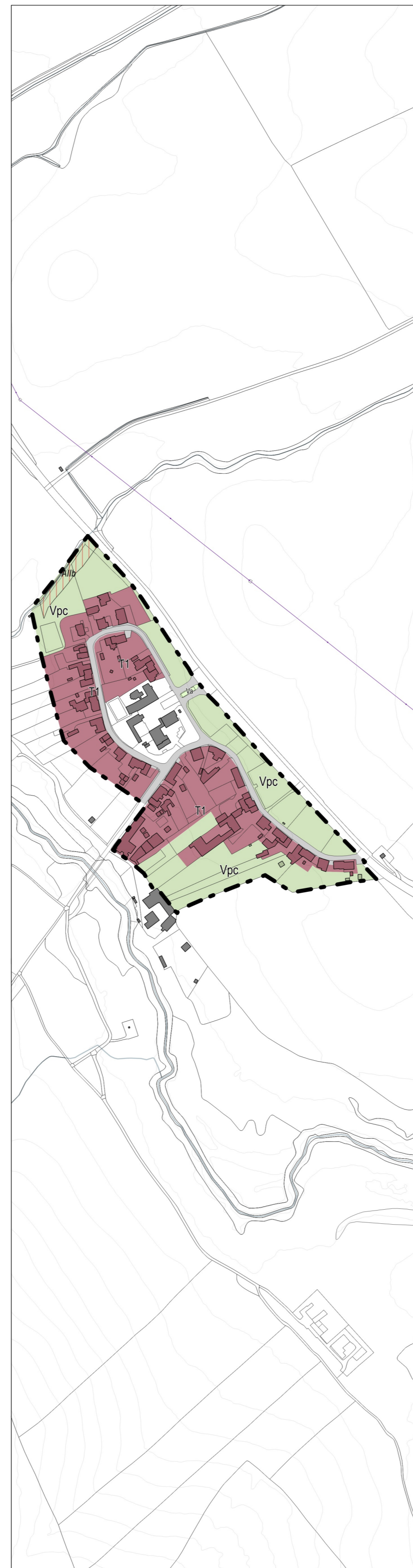
Borgo Picciano A