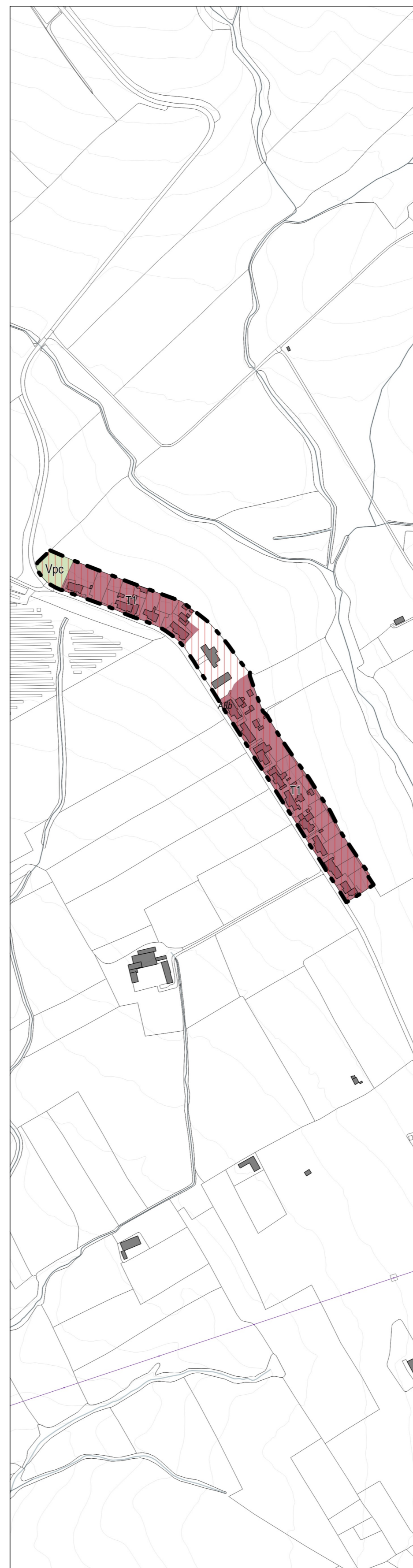
Borgo Picciano B